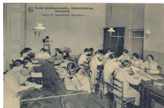
■ Carte postale : Intérieur de l'École Bischoffsheim, Bruxelles