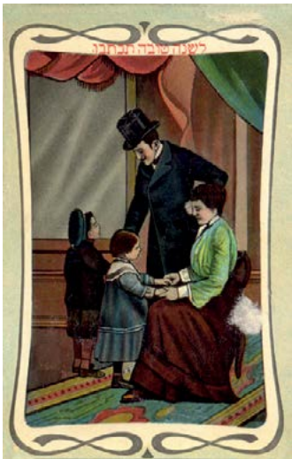
■ Carte de vœux de nouvel an, bilingue hébreu-allemand. *