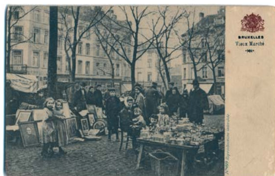
■ Carte postale : « Marché aux Puces » de la Vosseplein (actuelle Place du Jeu de Balle). Édition Grand Bazar Anspach © coll. Gérard Silvain, publiée dans P. PIERRET, G. SILVAIN, op. cit. , p. 144

À la veille de la Seconde Guerre mondiale, la Belgique compte près de 70.000 Juifs. Les uns sont belges depuis plusieurs générations, d'autres ont fui l'Europe de l'Est et les pogroms dans les années 1920 ou l'Allemagne nazie dès 1933. Leurs origines géographiques et leur milieu social sont souvent très différents ; certains sont religieux, d'autres non, certains sont fortunés et belges depuis plusieurs générations, d'autres, sans ressource, viennent d'arriver et se débrouillent pour sortir de la misère.