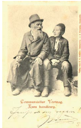
■ Leçon de commerce. Carte émise à Czernowiz (Ukraine) en 1899. Édition Schiller *