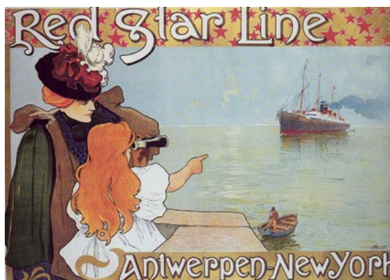
■ Red Star Line poster, Henri Cassiers, vers 1899

Ce n'est qu'à la fin du 19 e siècle que l'on peut parler d'une importante immigration juive en Belgique et plus particulièrement à Anvers. Après la Première Guerre mondiale, l'immigration est plus massive et jusqu'aux années 1920, la ville d'Anvers se caractérise par un climat assez tolérant à l'égard des Juifs. En ce sens, on peut parler d'une ville cosmopolite. En plus des Juifs de Russie et de Pologne qui fuient les persécutions (appelées Pogroms), de nombreux migrants passent par le port d'Anvers pour se rendre en Amérique.