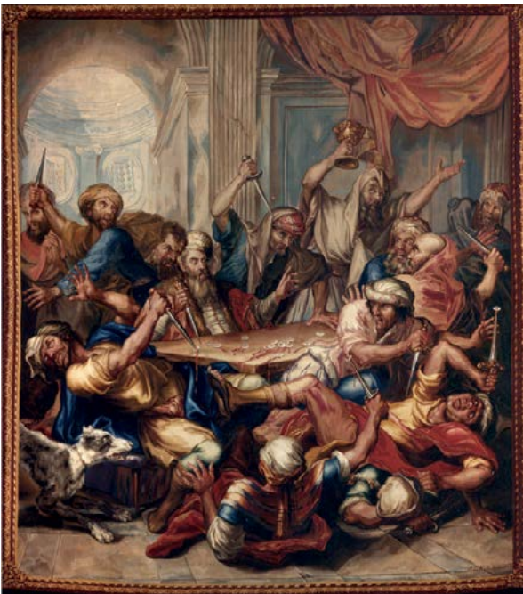
■ Frans Van der Borcht, tapisserie représentant la profanation des hosties dans la synagogue de Bruxelles, 1770 - collection de la Cathédrale Saints-Michel-et-Gudule

(Extrait de Profanation des hosties de Bruxelles de 1370. Présence, récurrence et persistance d'un mythe , par Philippe Pierret, Musée Juif de Belgique, 2009)