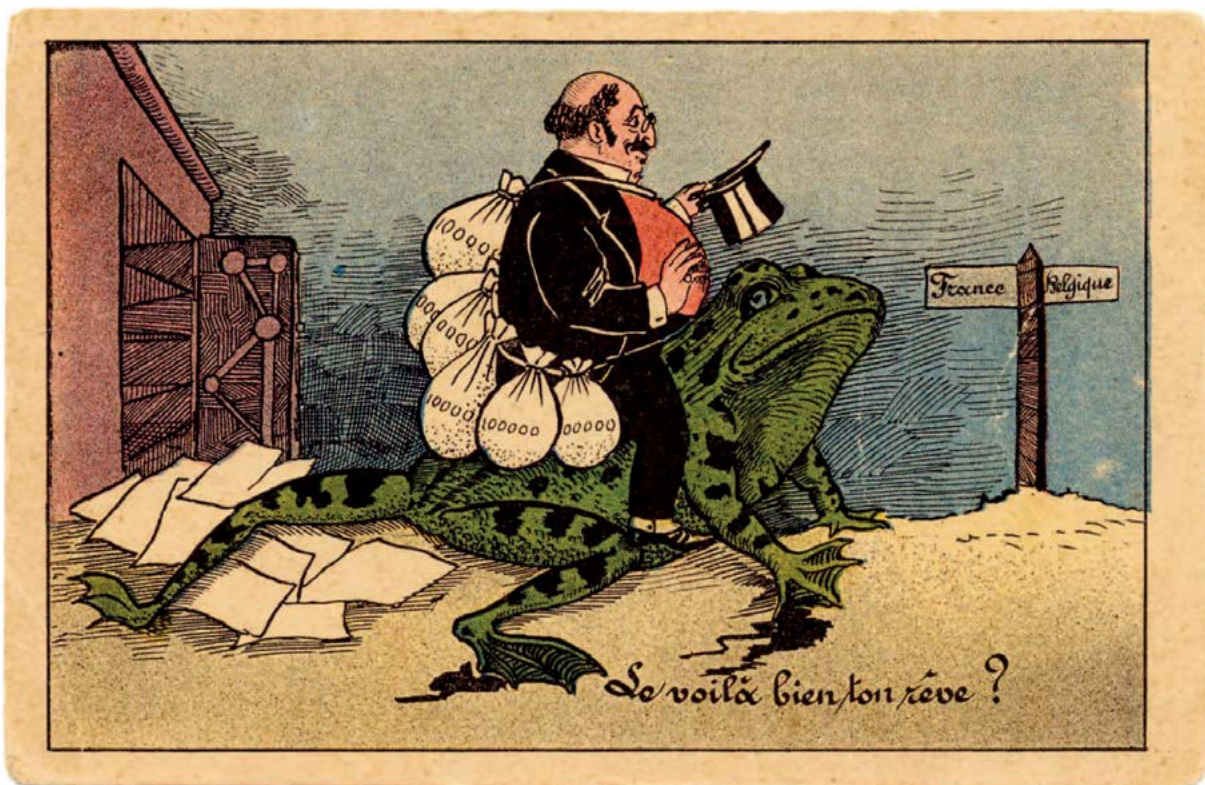
■ Carte postale : Caricature antisémite © coll. Silvain, publiée dans P. PIERRET, G. SILVAIN, op. cit. , p. 209

Le crapaud est aussi un animal réputé vorace, qui se nourrit de petits animaux (insectes, vers de terre...), ce qui par analogie renvoie à un personnage qui s'enrichirait sur le dos des autres, les non-Juifs.